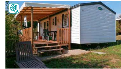
MOBIL HOME TYPE III FAMILY CONFORT (30M 2 )