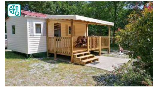
MOBIL HOME TYPE III BABY CONFORT (25M 2 )