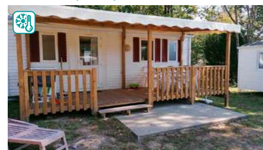
MOBIL HOME TYPE III CLASSIC CONFORT (27M 2 )