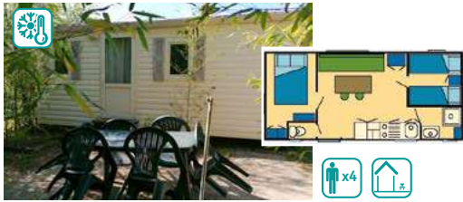
MOBIL HOME TYPE III BABY (25M 2 )