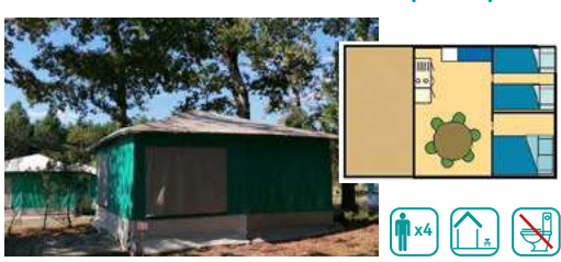
BUNGALOW TOILÉ CARAIBE (19M 2 )