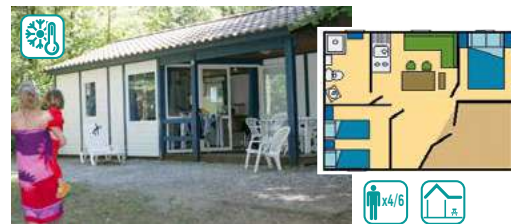
CHALET RÊVE (29M 2 )