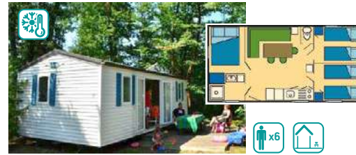
MOBIL HOME TYPE III FAMILY (30M 2 )