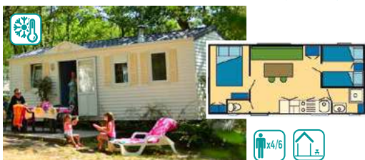
MOBIL HOME TYPE III CLASSIC (27M 2 )